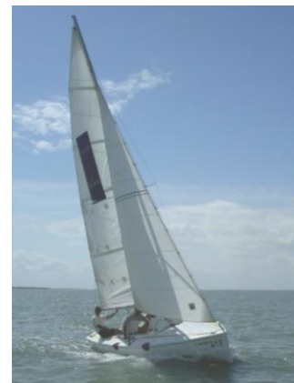
Le proto pour l'ENSMA (2005)