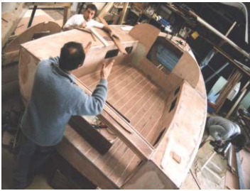
Echanges sur le chantier (1999)