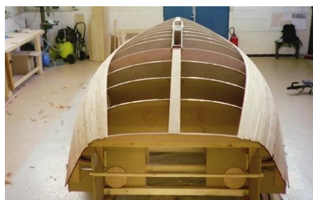
6m10 cap Vert