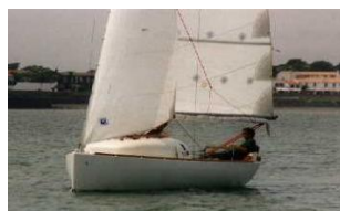
« Le Loustic » (1999)