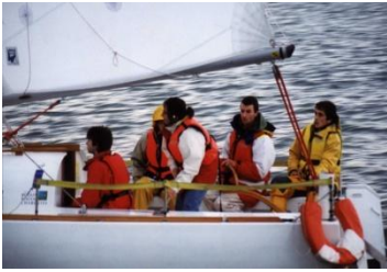
Navigation en équipage (Arz, 1999)