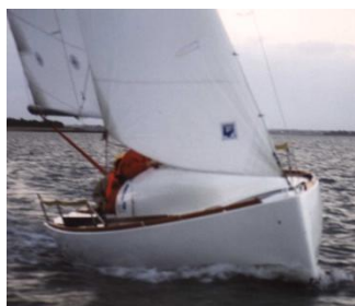
Le Loustic fend la bise (2003)

...et la navigation leur a permis de développer l'esprit de groupe et le sens des responsabilités.