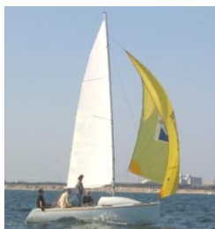
« Le 6m10 »(2003)