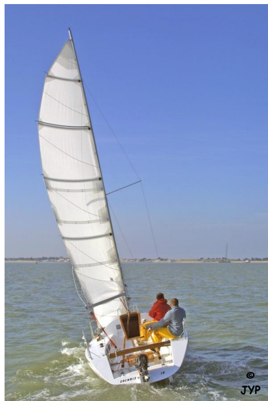
Un voilier à quille relevable de 6m10