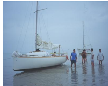
Débarquement sur l'île de Ré (2003)