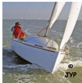
Avec Loisir Nautiques (2005)